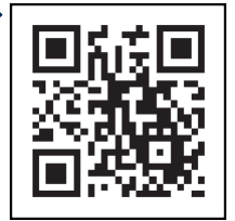
「コロナワクチンナビ」 二次元コード