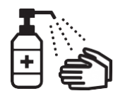
손 소독용 알코올 사용하기

홈페이지를 확인할 수 없는 경우는 거주하시는 시정촌(市町村) 등에 상담해 주십시오.