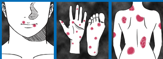
口などに できもの

梅毒の原因は梅毒トレポネマという病原菌が性行為によって感染し、感染した部位にしこりができるなど、経過によって様々な症状が出ます。