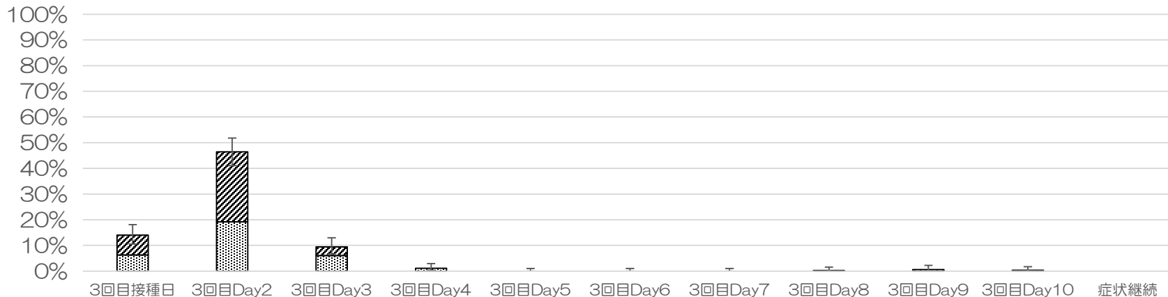
接種後8日間以内に発現した特定AEの年齢/性別ごとの頻度