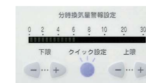
分時換気量警報設定