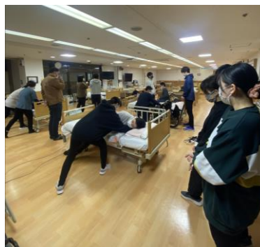
職員主導の移乗実地研修