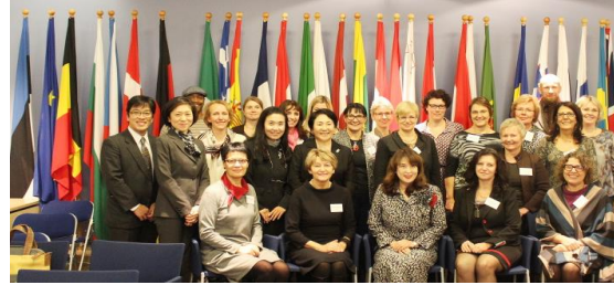
海外との交流研修