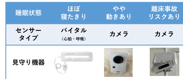
利用者の状態に応じたテクノロジーの選択