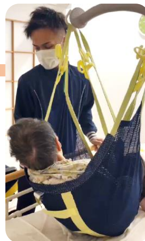
ノーリフティングケアによる腰痛対策