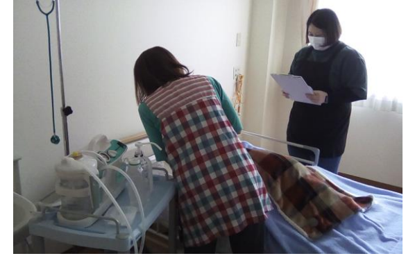
喀痰吸引実地研修