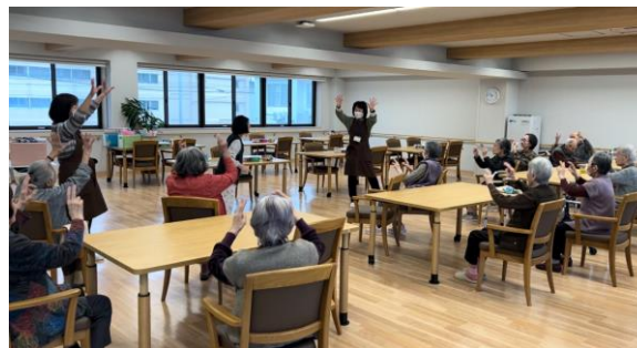
サポーターによる レクリエーション風景（コミサポ）