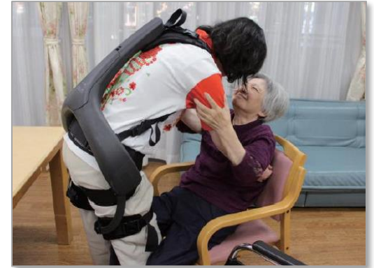
装着型移乗支援機器