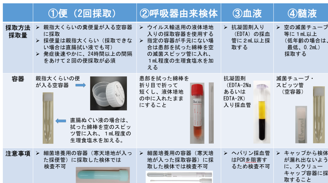
図表 7 ウイルス検体採取方法図 14