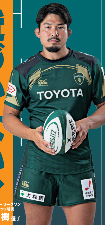
ジャパンラグビーリーグワントヨタヴェルブリッツ所属 姫野和樹 選手