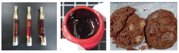
大麻リキッド 大麻ワックス 大麻クッキー

「大麻リキッド」「大麻ワックス」など大麻から幻覚成分を抽出・濃縮した加工品が摘発されています。また海外旅行のお土産としてもらったものでも違法です。