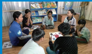
カンボジア：若者中心のワークショップ