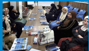
イラク：指導者対象の薬物乱用防止研修